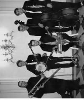
RTO 2007 - Château de Saint-Haon

Le quintette a aussi la particularité de chanter ce qui rend son concert très vivant